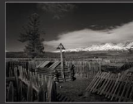
Кладбище у села Курай, 2013 г.