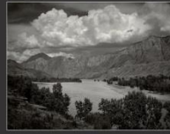
Катунь у села Ингены, 2011 г.