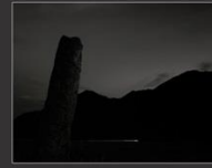
Каменный воин и свет фара, Кур - Кечу, 2013 г.