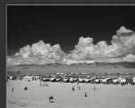
Ярмарка, Кош-Агач, 2013 г..