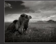
Верблюд и автомобиль, Чуйская степь, 2013 г.