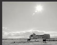
Два быка, Чуйская степь, 2013 г.