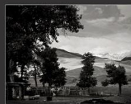
Пастушья стоянка, Курайский хребет, 2013 г.