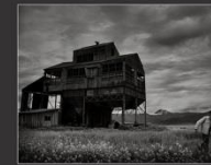
Элеватор, Уймонская степь, 2013 г.