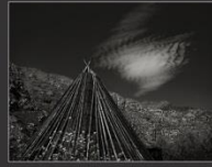
Чадыр, устье реки Ильгумень, 2013 г.