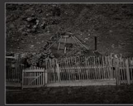
Али у склона горы, село Иня, 2013 г.