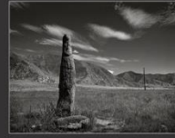
Каменный воин, Кер-Кечу, 2013 г.