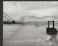
Два моста, река Катунь, 2013 г.