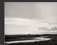
Юрта и река, Чуйская степь, 2013 г.