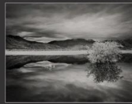
Весенний паводок, Уймонская долина, 2013 г.