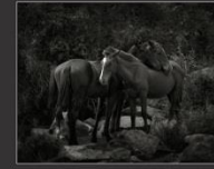
Дремлющие лошади, 2011г.