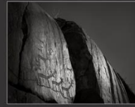
Наскальные рисунки, Калбак Таш, 2013 г.