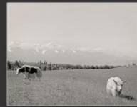
Два яка, Курайская степь, 2013 г.