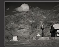
Детский сад, село Иня, 2013 г.