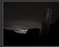
Чуйский оленный камень и луна, 2013 г.